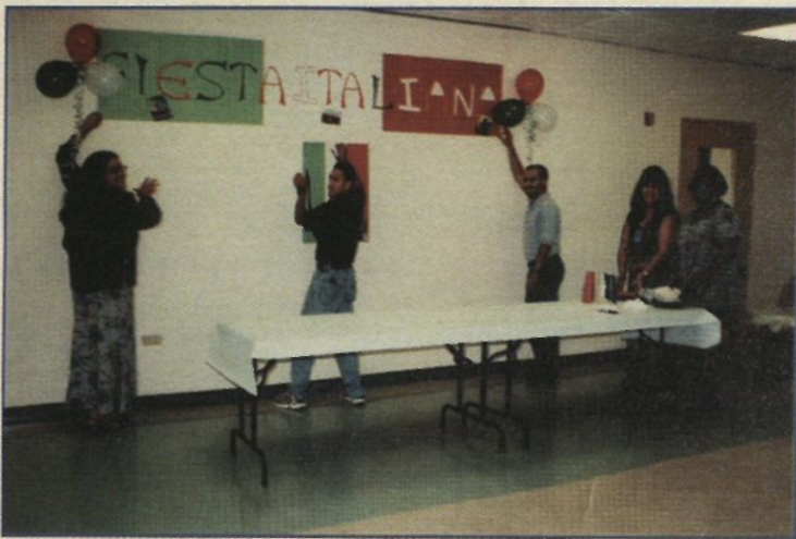
En cuestión de minutos los encargados de la decoración crearon un magnífico ambiente italiano.