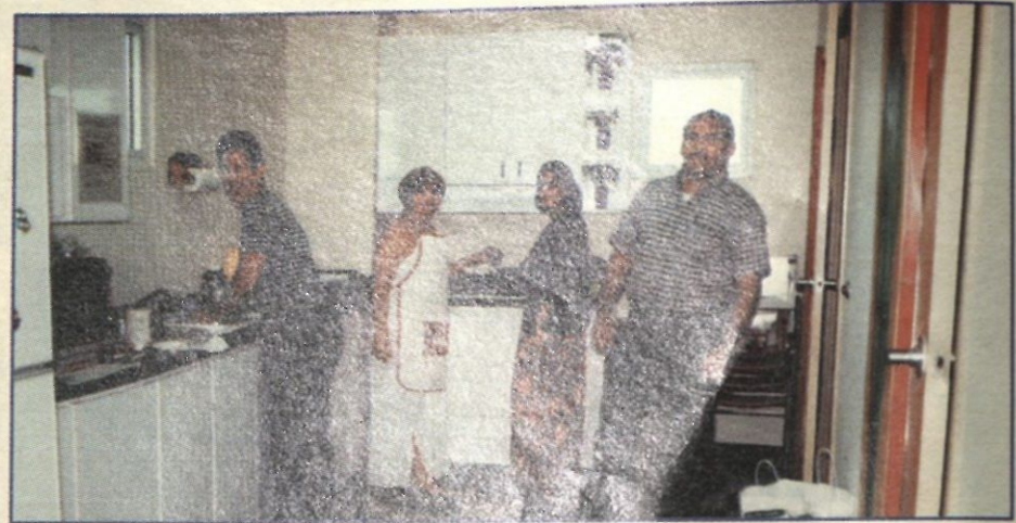
No tuvimos que contratar «chefs» italianos, ya que los hay muy buenos en el personal de la biblioteca.