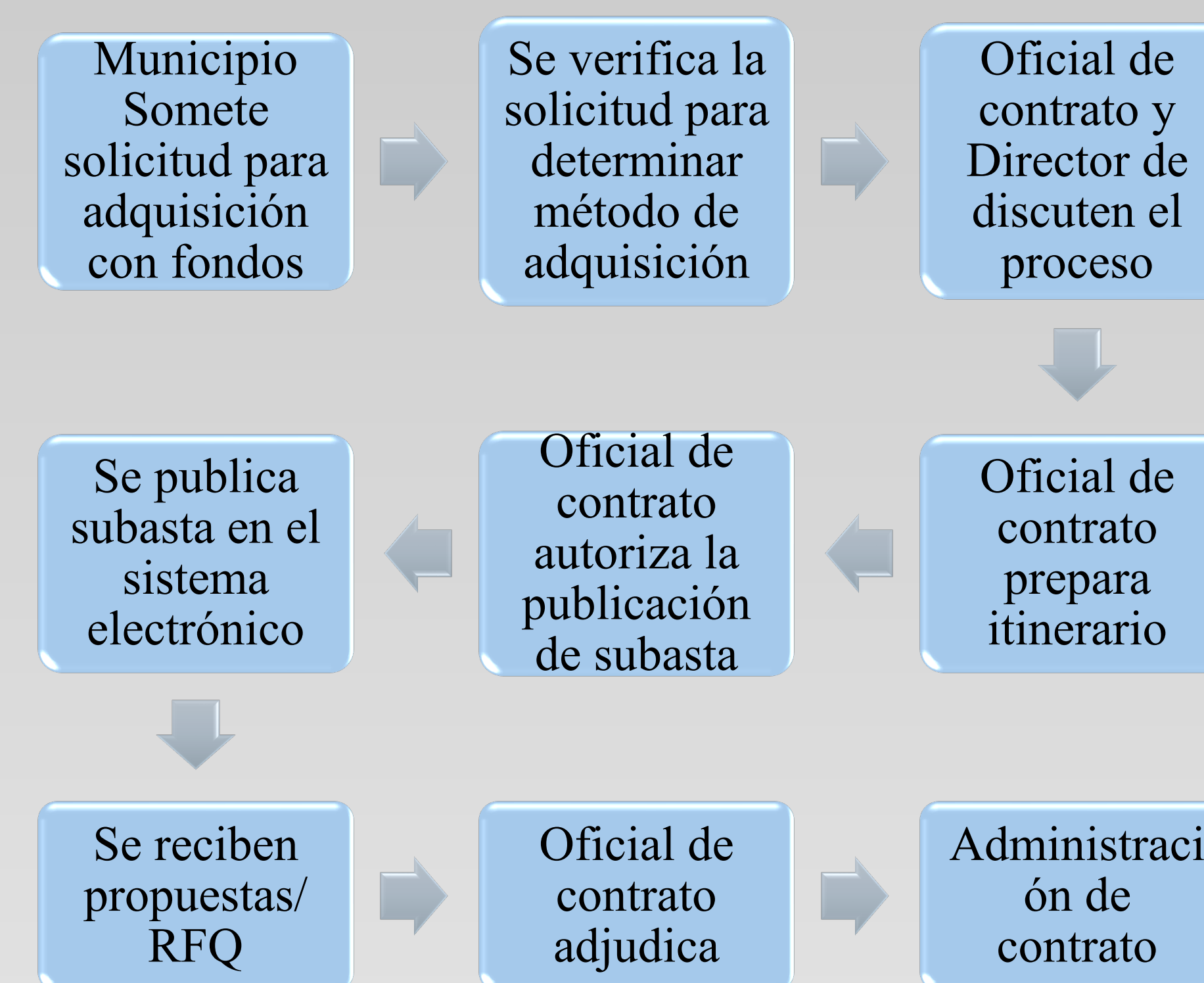
Figura 2: Proceso de Subastas