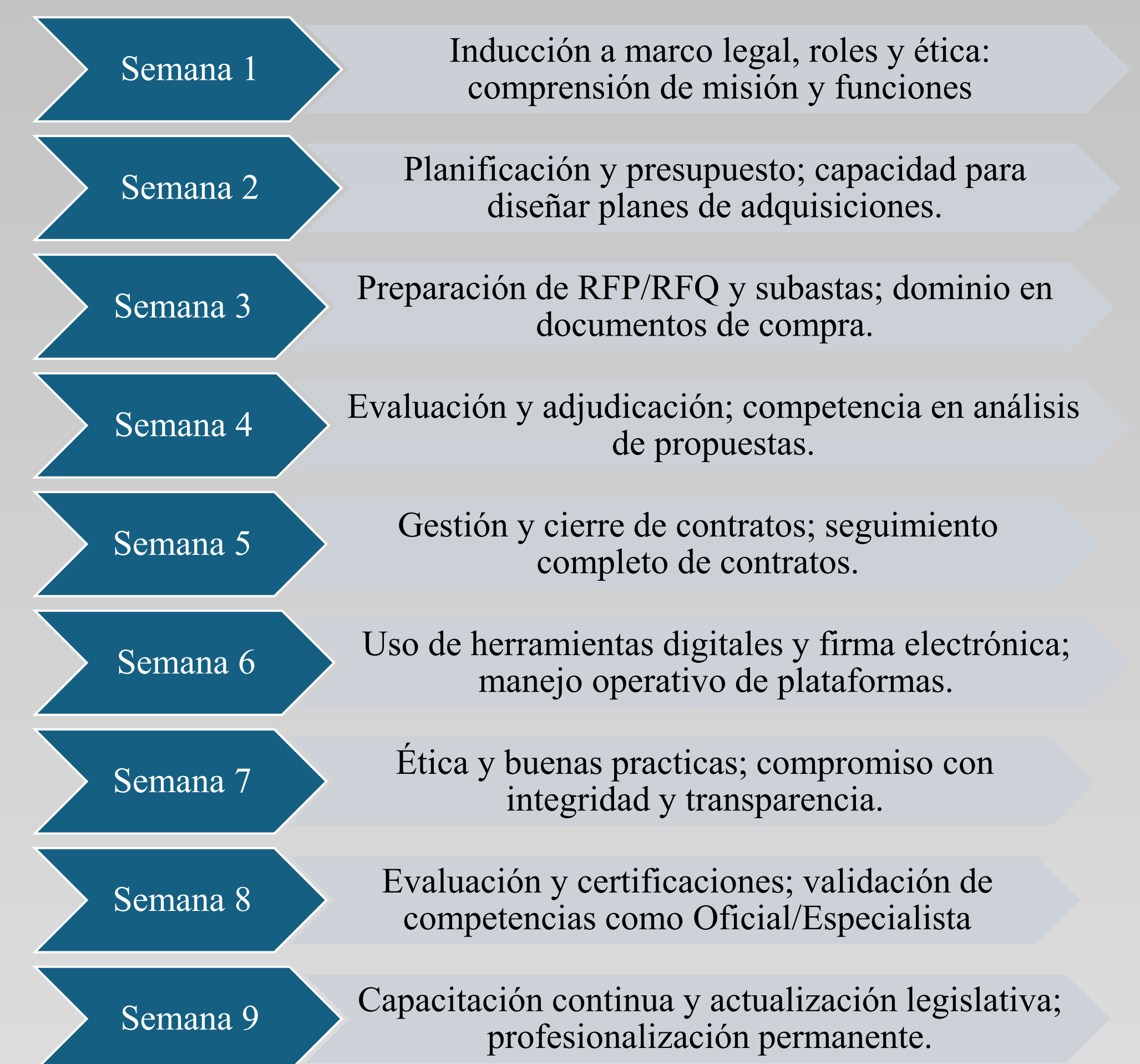
Figura 4: Programa de capacitación