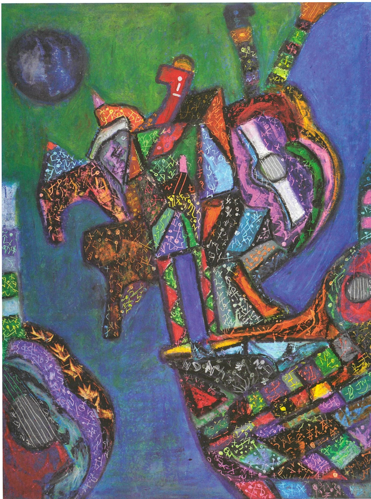
La parranda de los poetas , Jan Martínez. Pastel sobre papel. 2019