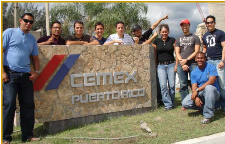
Estudiantes del Capítulo Estudiantil durante su visita a la Planta de CEMEX Puerto Rico en Ponce