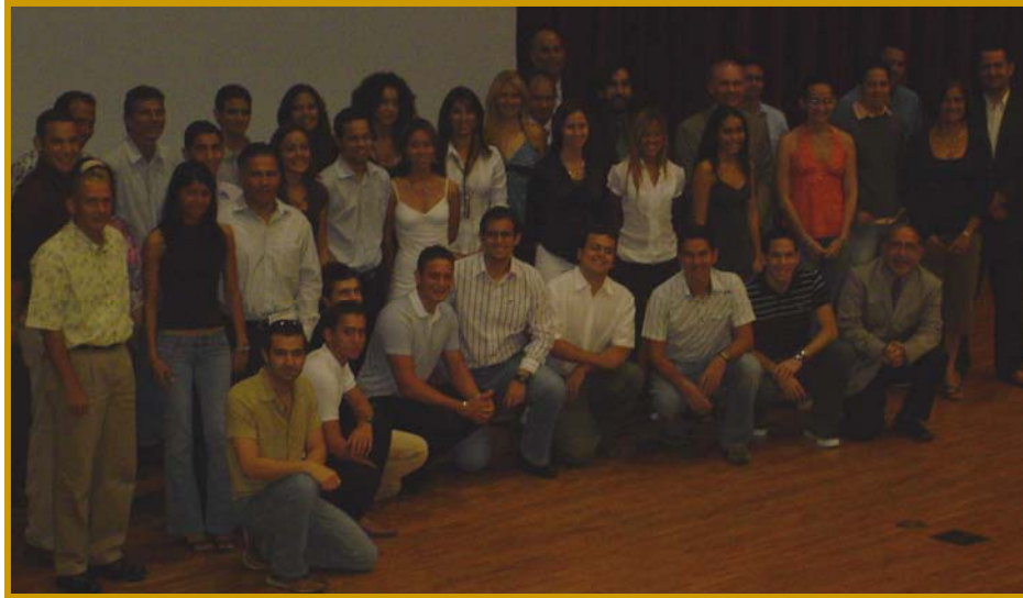
Estudiantes del Cuadro de Honor y profesores del Departamento durante la Ceremonia

Los requisitos para que los estudiantes subgraduados de Ingeniería Civil o Ingeniería Ambiental sean incluidos en el Cuadro de Honor del Departamento son los siguientes: a) haber aprobado un mínimo de 80 créditos, de los cuales un mínimo de 50 créditos deben haber sido tomados en la UPPR y b) mantener un promedio académico mínimo de 3.25.