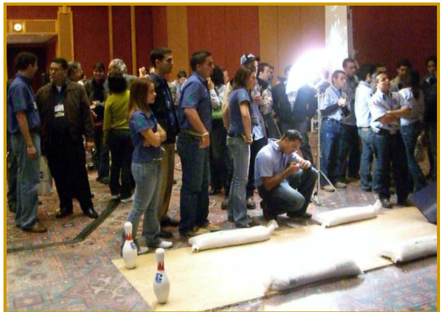
Zona de rodaje para las bolas de boliche