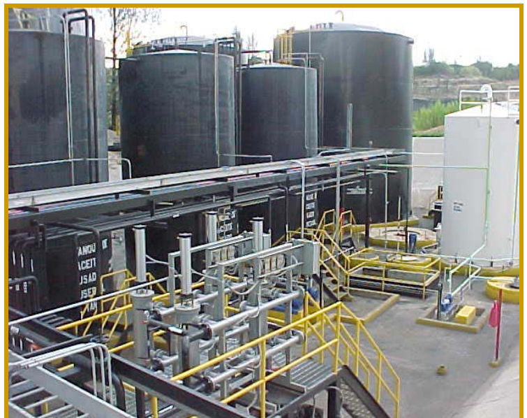
Facilidad de recuperación de aceites de motor usados

Durante este trimestre WT/06 los estudiantes están diseñando una facilidad en la cual se pueda recolectar el aceite usado de motor, se filtre de manera tal que el mismo pueda reutilizarse como combustible alternativo, mezclarse con otro tipo de combustible como lo es el biodiesel, o utilizarse como ingrediente en plantas de carbón o en la manufactura del cemento (hornos) dependiendo de cual sea la demanda de este aceite purificado. Además de recolectar y purificar el aceite usado, se consideró el diseño de varias unidades que purifiquen el agua proveniente del aceite, la cual se pueda reutilizar en sistemas de riego o como agua no potable en proyectos de construcción. Algunas de las unidades que se consideran son el carbón activado y sistemas de separación de agua y aceite, como los sistemas de flotación o los separadores API (American Petroleum Institute). En el diseño de las facilidades los estudiantes deben incluir la selección y dimensión de los tanques de recibimiento, separación y almacenamiento para el aceite, los diques y la contención secundaria para los tanques y el local, las tuberías por donde fluya el aceite, un estudio hidráulico y el diseño de las tuberías para drenaje del lugar propuesto, el diseño de una laguna para escorrentía pluvial, las unidades de tratamiento de agua para el agua separada del aceite, los controles para minimizar las emisiones de aire y el desarrollo de un plan de emergencia en caso de que ocurra un derrame.