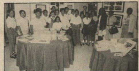
Un grupo de estudiantes de los muchos que nos visitaron durante la Semana de la Biblioteca.

nencia (Alma Mater) por nuestra Universidad. Las generaciones futuras conocerán la obra educativa que hemos realizado para que ellos la disfruten.