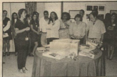
Parte del grupo asistente a la inauguración del Museo Histórico de la Universidad Politécnica de Puerto Rico.

El lunes 14, inauguramos la exposición de cuadros del artista Sixto Febus y dimos el corte de cinta del Museo de Historia de la Universidad Politécnica de Puerto Rico. Este año nos visitaron cerca de 200 estudiantes de diferentes escuelas, los cuales recibieron orientación sobre la importancia de preservar los recursos educativos.