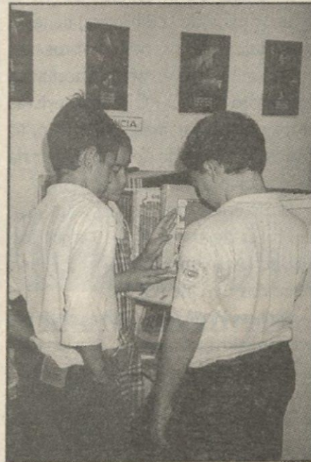
Estudiantes visitantes se interesan en los recursos expuestos por la Biblioteca durante su participación en el IV Encuentro...