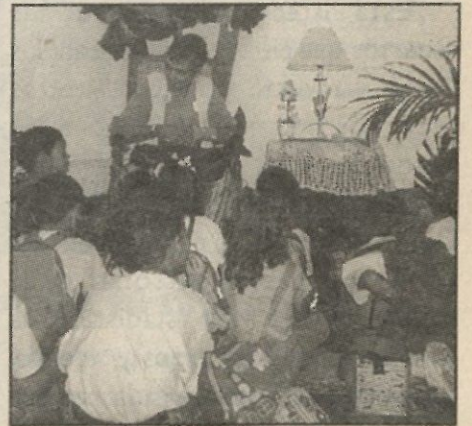
Una abuelita voluntaria narra cuentos a grupo de niños que visitaron la Biblioteca instalada por la UPPR en el Convento de los Dominicos durante el IV Encuentro de Niños, Jóvenes y Adultos por el Mundo del Libro.