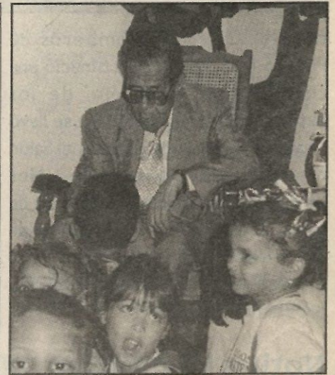
Don Enrique Laguerre, homenajeado de la actividad, comparte con algunos niños que visitaron la Biblioteca instalada por nuestro personal en el Convento de los Dominicos, y ofrece autógrafos a sus libros.