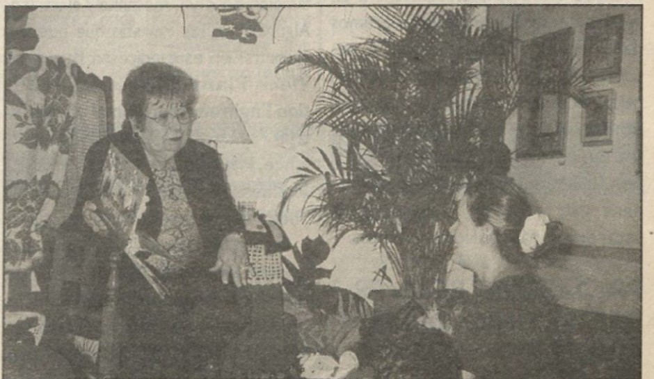
Abuelita voluntaria lee a los niños, durante la actividad del IV Encuentro...