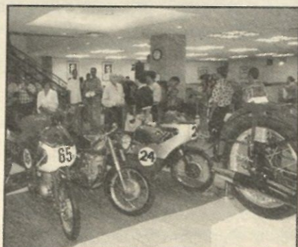
Estudiantes y público se interesan en la exhibición de motoras en la Biblioteca.