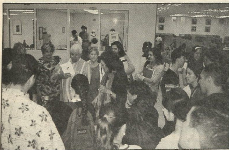
Profesores y estudiantes se interesan en la exposición del taller de Escultura del Centro de Bellas Artes de Guayama.