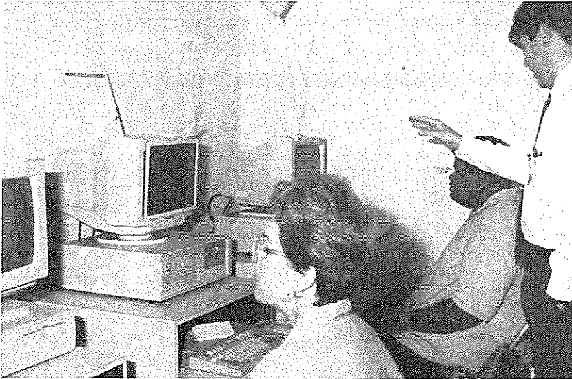
Empleados de la Biblioteca y estudiantes durante la demostración de la red local de CD ROM.