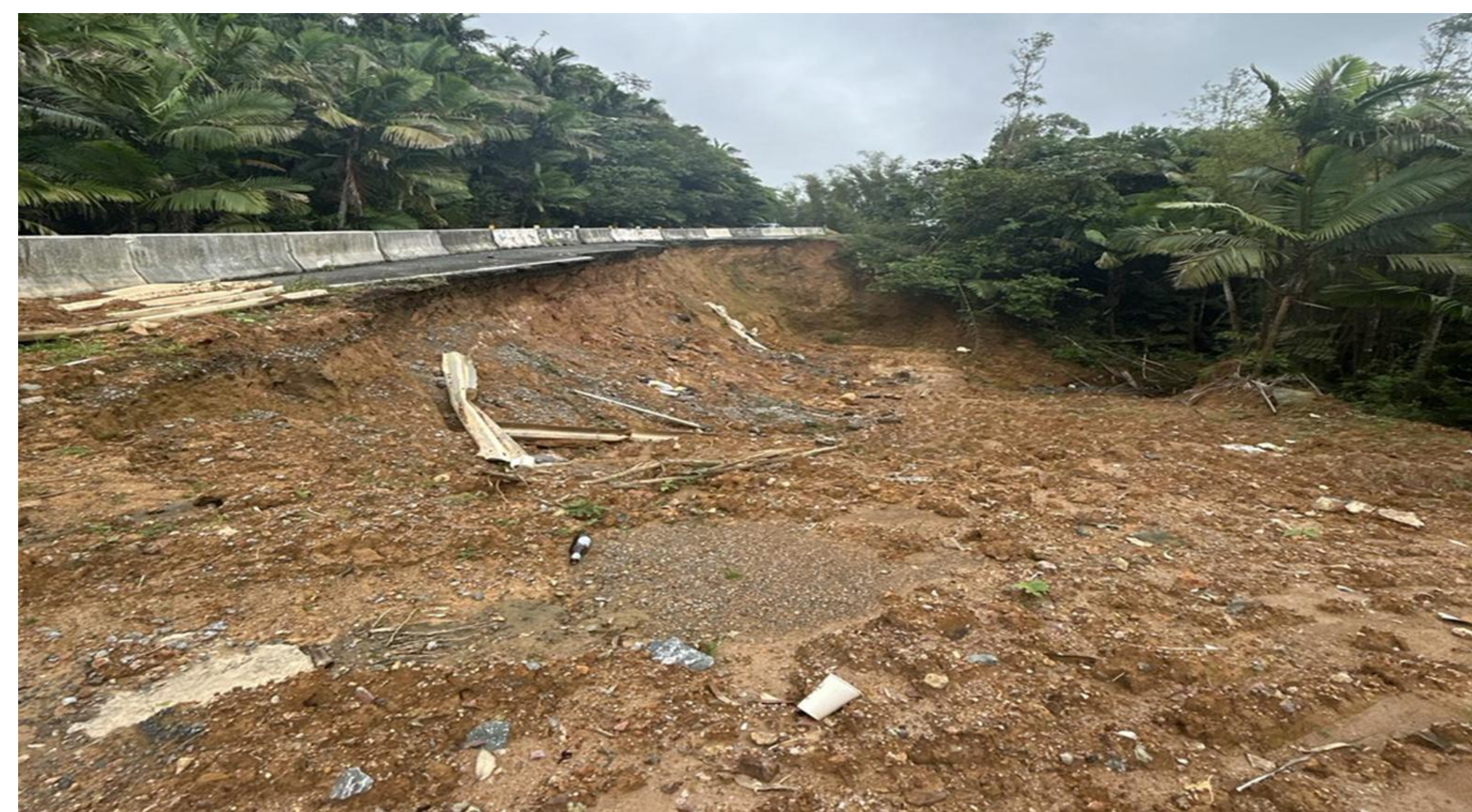
Figura 1. Condición de inestabilidad previa al evento de derrumbe en la carretera PR-184, kilómetro 20.8, Patillas, Puerto Rico (imagen histórica utilizada con fines ilustrativos).

El caso de estudio se ilustra mediante una condición histórica del talud mostrada en la Figura 1, la cual se presenta únicamente con fines ilustrativos del procedimiento propuesto.