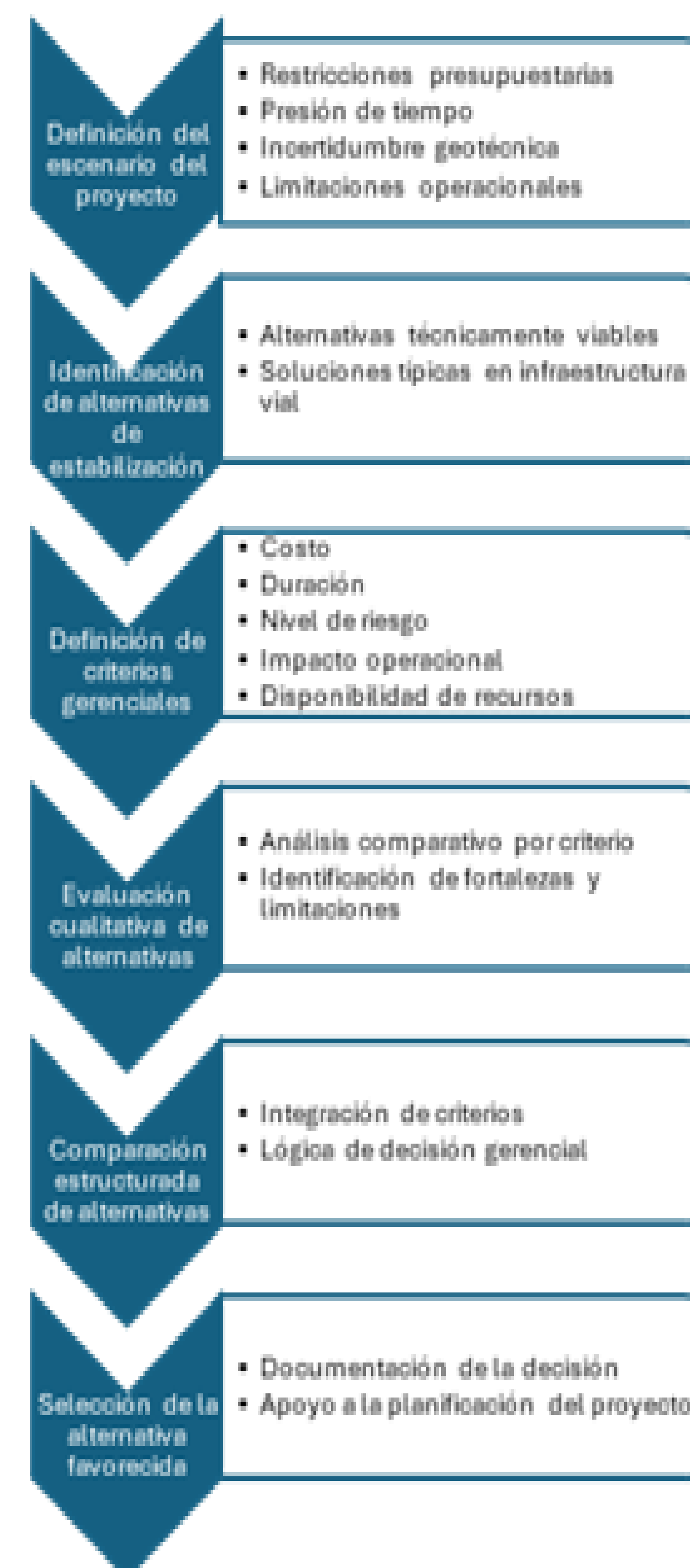
Figura 3. Criterios Gerenciales para la Evaluación de Alternativas